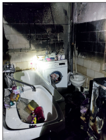
Požár Dolní Poustevna

Po zjištění, kde se nachází místo hoření, došlo k okamžitému vstupu do bytu a k likvidaci požáru. Naštěstí požár nebyl velkého rozsahu a likvidace byla rychlá. Po odvětrání všech prostor se mohli klienti vrátit zpět do svých bytů. Na dotaz: proč u tohoto požáru bylo tolik jednotek? Odpověď je jednoduchá: když se jedná o požár, kde se nachází více osob v jedné budově (v tomto případě starších osob), operační středisko vyšle veškeré dostupné síly,