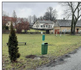
Instalace odpadkových košů na psí exkrementy u sběrných hnízd, u Slovanky a u hřiště Pacajda.