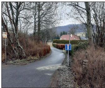
Instalace dopravního značení „slepá ulice“ pro lepší orientaci poblíž autoservisů Skukálek.