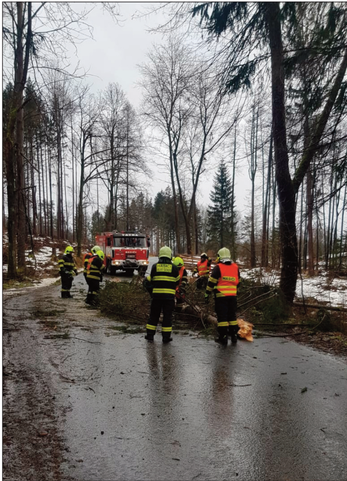
Strom směr Mikulášovic

V únoru naše jednotka byla operačním střediskem vyslána k šesti událostem. Třetího února jsme zasahovali na komunikaci směrem do Mikulášovic, kde došlo k pádu stromu. K této události jsme vyjeli CAS20 v šestičlenném družstvu. Na místo události dorazila i jednotka z Mikulášovic. Společnými silami jsme strom rozřezali a odklidili. Sedmého února si naši pomoc vyžádala posádka ZZS a to s trans-