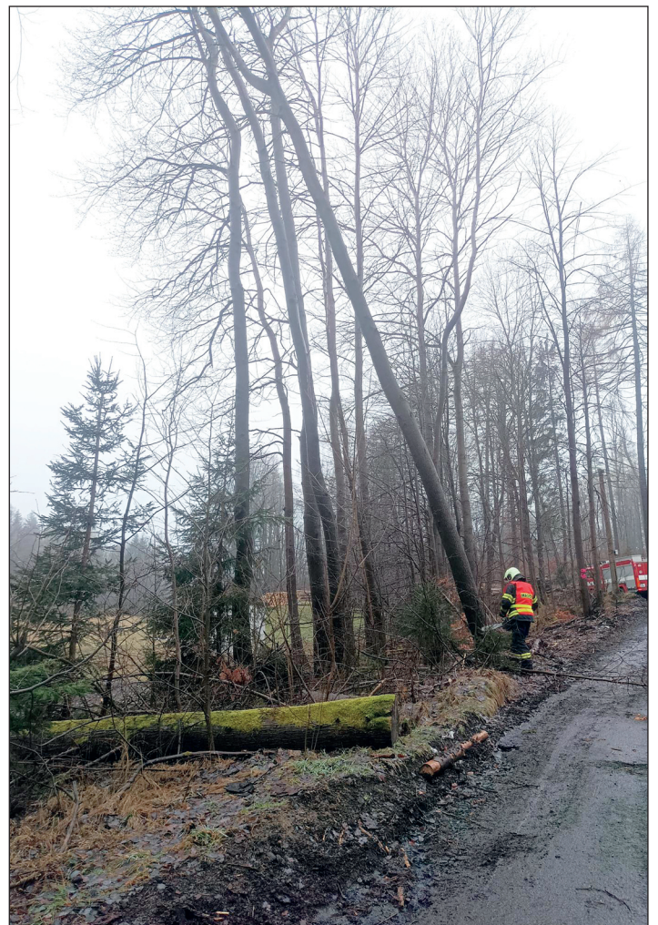
Strom hrozící pádem