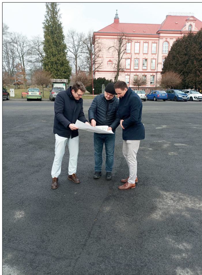
Fyzická prohlídka náměstí a jeho okolí s architektem a projektantem ohledně územní studie na revitalizaci náměstí.