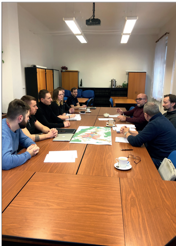
Schůzka za účelem urychlení dokončení územního plánu.